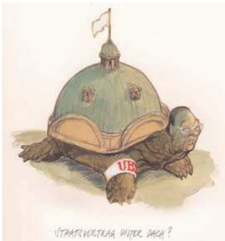
Pacto estatal a cubierto

PETER GUT, nacido en 1959, es uno de los caricaturistas más notables de Suiza y trabaja regularmente para el periódico «Neue Zürcher Zeitung» y otras publicaciones. Ilustramos el artículo sobre Suiza como centro financiero con sus comentarios en forma de dibujos sobre el caso de la UBS y la crisis financiera.